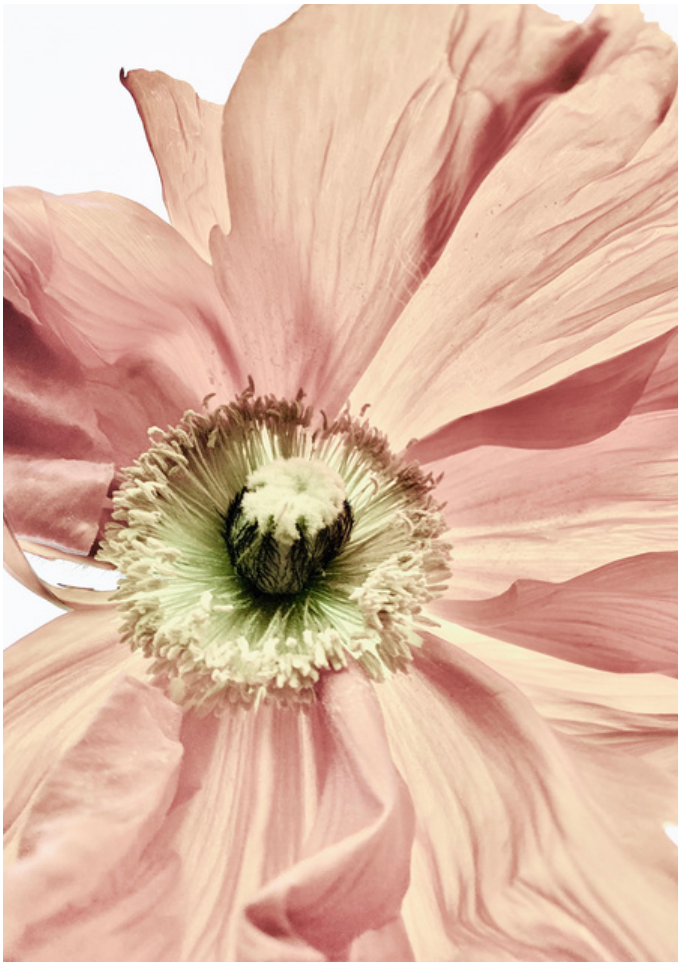
Sophie Le Gendre, douceur 9 , 2022, tirage sur papier fine art, 120x80cm, édition de 5