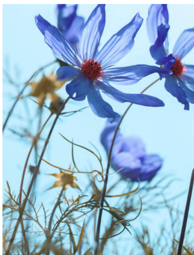
Sophie Le Gendre, céleste 1 , 2022, tirage sur papier fine art, 120x80cm, édition de 5