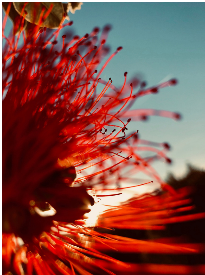
Sophie Le Gendre, respiration 7 , 2019, tirage sur papier fine art, 150x115cm, édition de 5

du 1er octobre au 20 novembre 2022 au 3e Cercle, 20 rue de la pierre levée, Paris XI les samedis de 14 à 19h, les dimanches de 14 à 17h, et en semaine sur rendez-vous