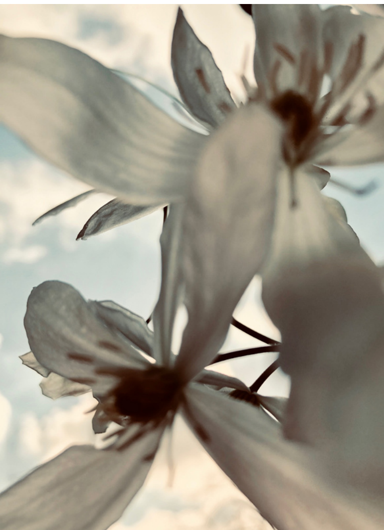
Sophie Le Gendre, respiration 2 , 2019, tirage sur papier fine art, 80x60cm, édition de 5