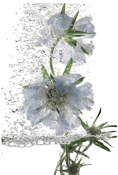
Sophie Le Gendre, renaissance 10 , 2021, tirage sur papier fine art, 120x80cm, édition de 5