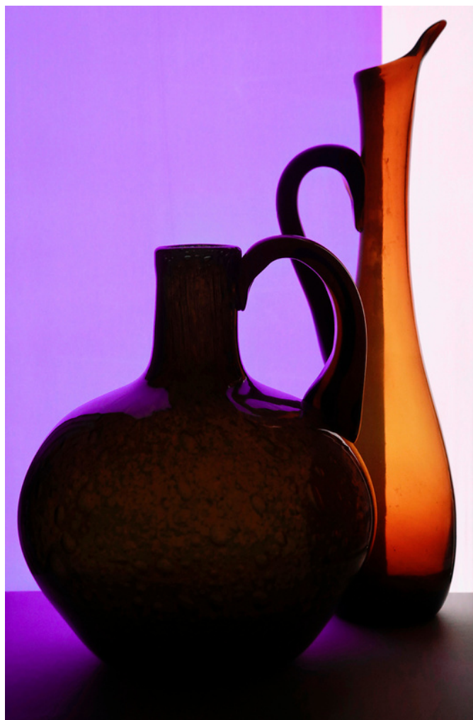
Sophie Le Gendre, transparence 5 , 2021, 150x100 cm, édition de 5