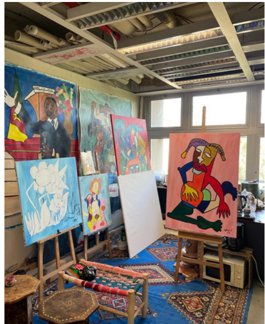
Vue de l'atelier d'enfant précoce à Saint-Denis et détail de la toile "Banc de tournesols"

Ses toiles mêlent des corps, tantôt tendus, tantôt assouplis, des mains écartées, des jambes projetées entre visages et masques africains. Mille et une couleurs fleurissent, à travers lesquelles l'artiste nous raconte des histoires qui touchent à l'universel. Le monde prend la forme d'un mythe qu'animent ses personnages comme des apparitions saisies dans la couleur et la disproportion.